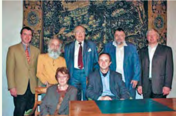
Le comité du Cercle vaudois de généalogie vous adresse ses vœux les meilleurs pour l'année 2007